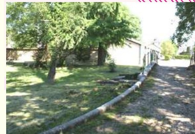
Parc à 30 mètres de l'Espace

Par les Apprentisseuses / Karine Trably Tarif libre sur inscription