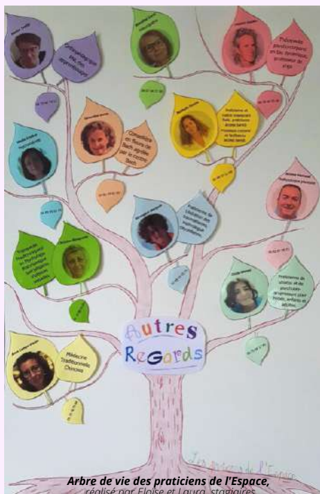
Arbre de vie des praticiens de l'Espace, réalisé par Eloïse et Laura, stagiaires