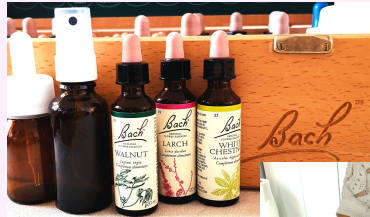
Fleurs de Bach