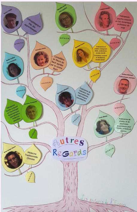
Arbre de vie des praticiens de l'Espace