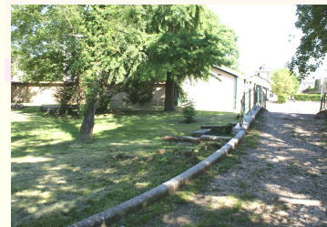
Parc à 30 mètres de l'Espace